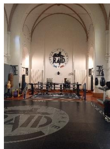
Exemples de visites :

Il est proposé en priorité aux étudiants du DU des sorties culturelles et visites relatives à la Police nationale ou en lien étroit avec les questions de sécurité.